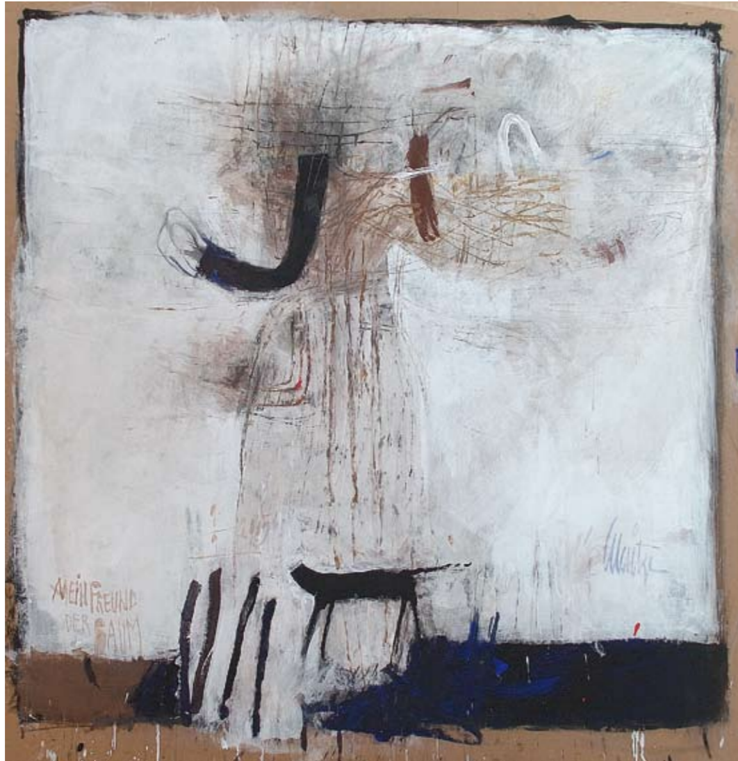
„Mein Freund der Baum“ Mischtechnik

Ludwig/Poxdorfer Weg 5 D-96110 Scheßlitz Phone: ++49 (0) 95 42 - 15 26