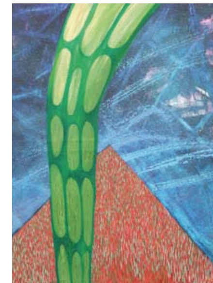
„Composition“ Öl auf Leinwand

Účast na společných a samostatných výstavách: ČR – Kolín, Praha, Uherské Hradiště, Poděbrady, Český Krumlov, Zlín, Kutná Hora, Písek, SRN – Augsburg, Passau, Frankfurt nad Mohanem, Drážďany, Francie – Montpon-Ménéstréol, Nizozemsko – Hilversum, Rakousko – Salzburg, Izrael – Jerusalem, Dánsko – Kodaň, Švédsko – Göteborg, Polsko – Poznaň, USA – New Orleans, Brüssel – Belgique, Eremitage – Bayreuth - Germany