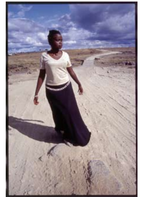
„Henrie Mutuku“ Fotografie

Lastly, my goal as a photographer is to continue inspiring young local photographers to take up this profession with passion and hopefully one day Africa can claim its own truly form of representation in the global community.