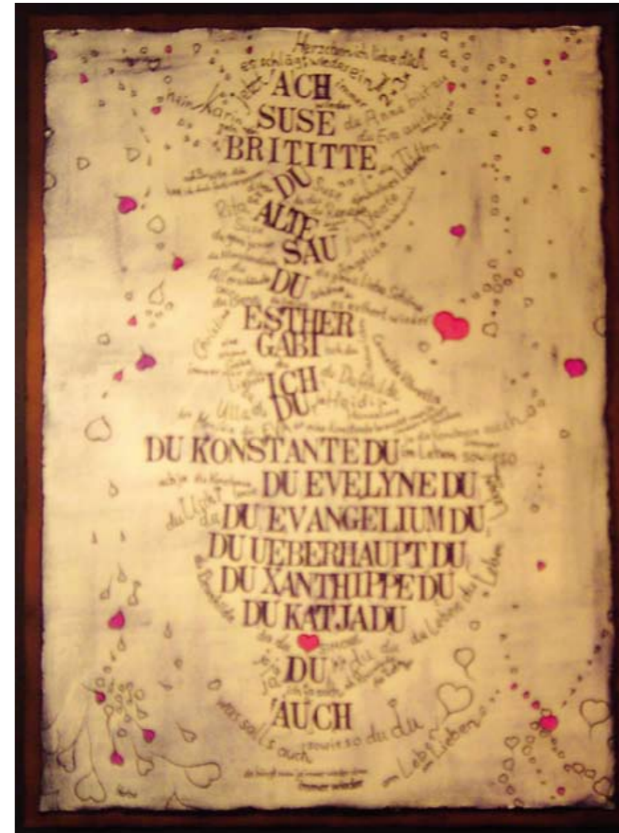
„Liebesbrief an die Suse und an das Leben (II)“ Mischtechnik

From 1976 until 2007 various individual expositions in Upper Franconia and beyond – in Neu-Isenburg/Gravenbroich as well as in Emsdetten/Westfalen