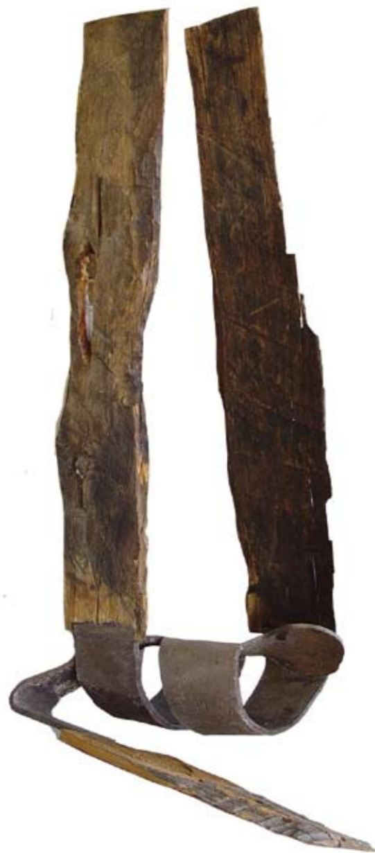
„Steel and Wood“ Objekt