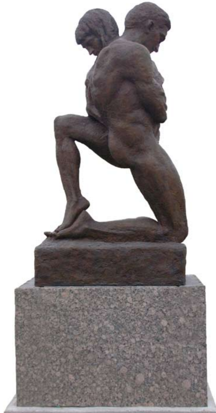
„Die Liebenden“ Bronze