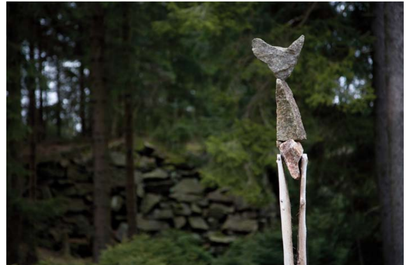
"Der Teufel vom Braurangenbruch - N50°08.825 E011°54.094" Landart / Fotografie

06/2007 Contemporary Art of Bohemian and Franconian Artists, Eremitage Bayreuth